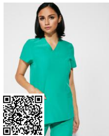
FEROX WOMAN CA9084