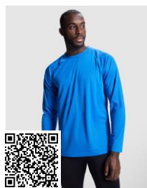
MONTECARLO L/S CA0415