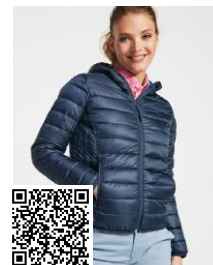
NORWAY WOMAN RA5091