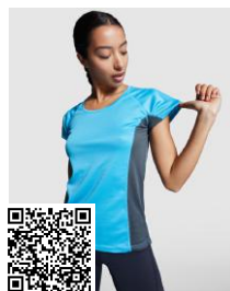
SHANGHAI WOMAN CA6648