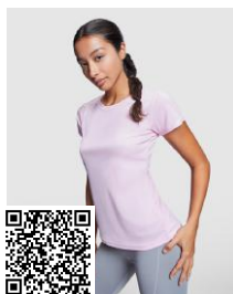
MONTECARLO WOMAN CA0423