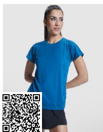
BAHRAIN WOMAN CA0408