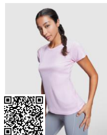
MONTECARLO WOMAN CA0423