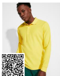
ESTRELLA L/S PO6635