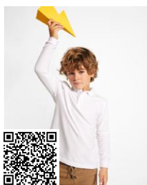
CARPE CHILD PO5008