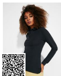
ESTRELLA WOMAN L/S PO6636